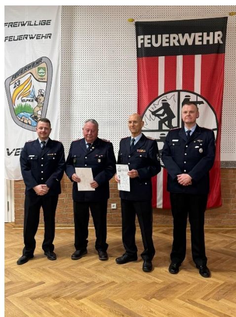
Ehrung der Förder- und Ehrenmitglieder