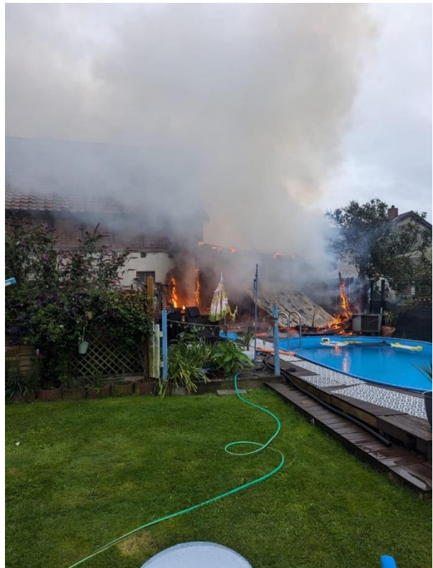
Feuer in Danndorf