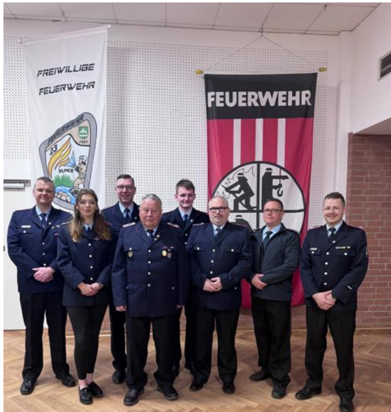
Gruppenfoto aller geehrten und Beförderten

In diesem Jahr wurden einige Kameradinnen und Kameraden befördert. Auch unsere Fördermitglieder erhielten Urkunden.