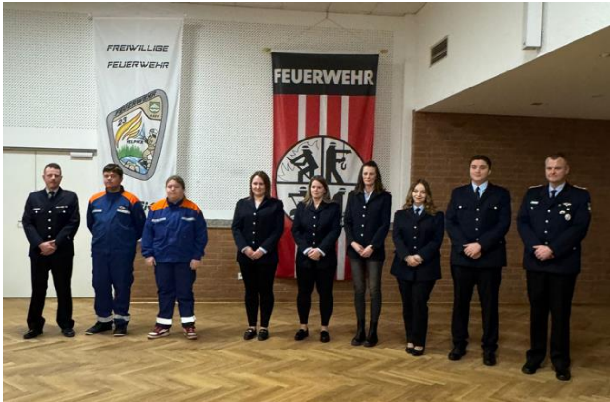
Neue Aktive Kameradinnen und Kameraden