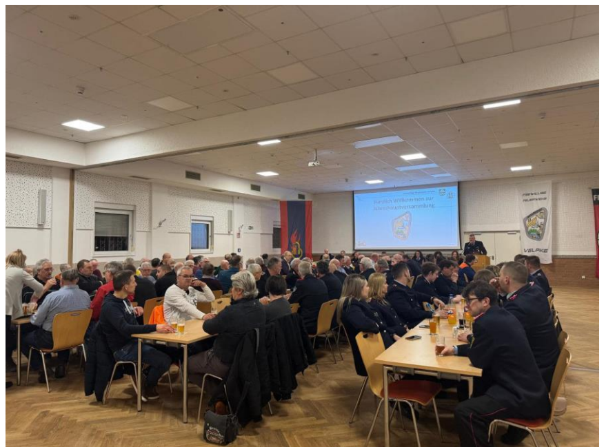
Zahlreiche Gäste folgten der Einladung