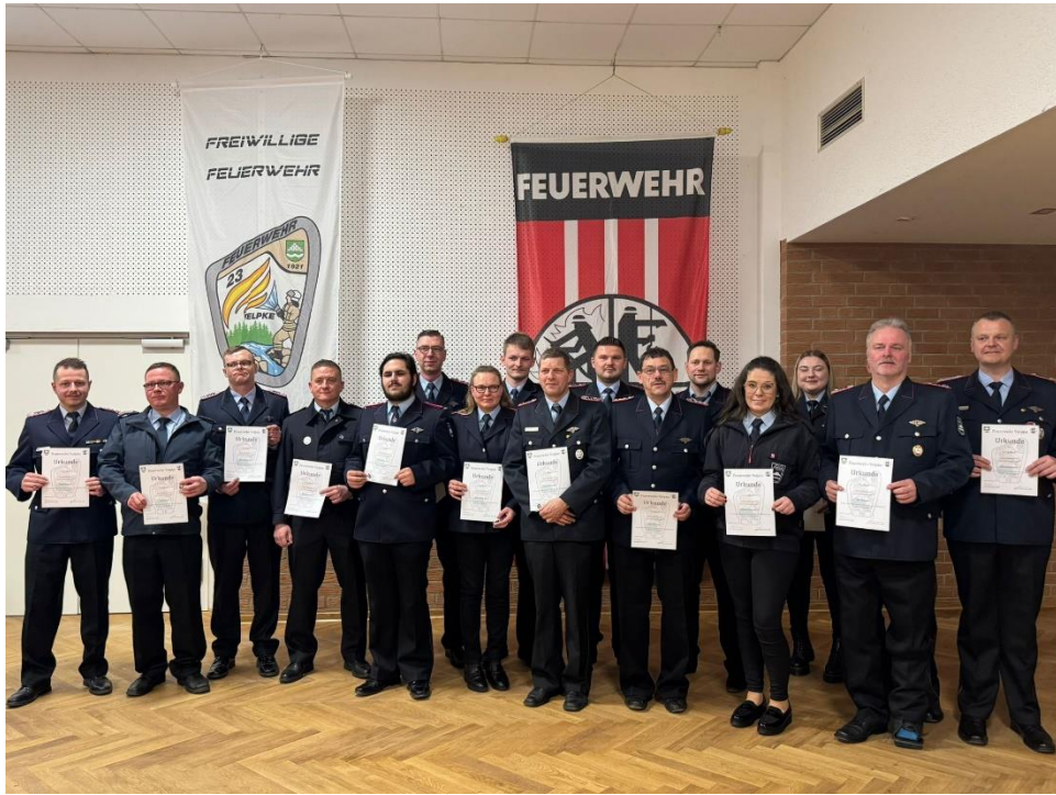
Ehrung für 10 jährige Mitgliedschaft