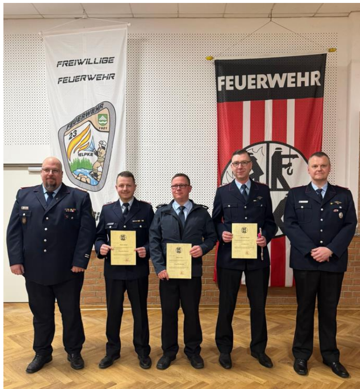
Beförderung Löschmeister und Hauptlöschmeister