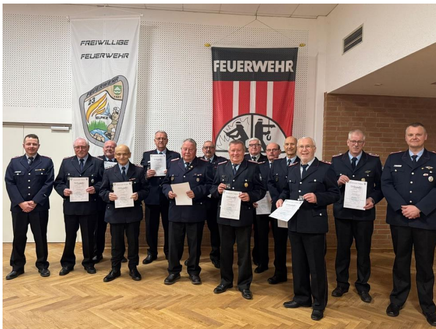
Ehrung für 10 jährige Mitgliedschaft (Aufgrund einer neuen Ehrung für Altersabteilung nachgeholt)