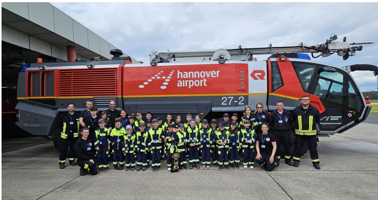
Besuch der Flughafenfeuerwehr

Auch die Kinderfeuerwehr war im letzten Jahr wieder sehr aktiv. Die insgesamt 30 Kinder und Betreuer trafen sich alle zwei Wochen zum Dienst und unternahm einige Ausflüge. Ein Höhepunkt im letzten Jahr war der Besuch der Flughafenfeuerwehr in Hannover.