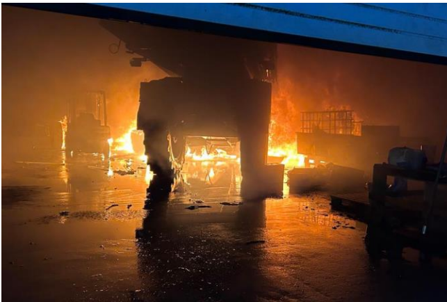
Großfeuer Klein Twülpstedt