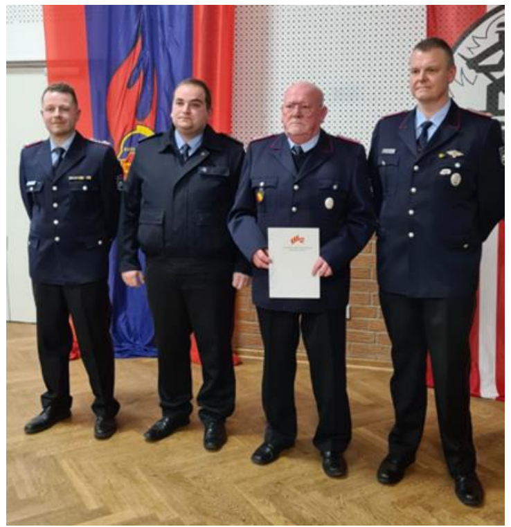
Ehrung für langjährige Mitgliedschaft (25 Jahre)