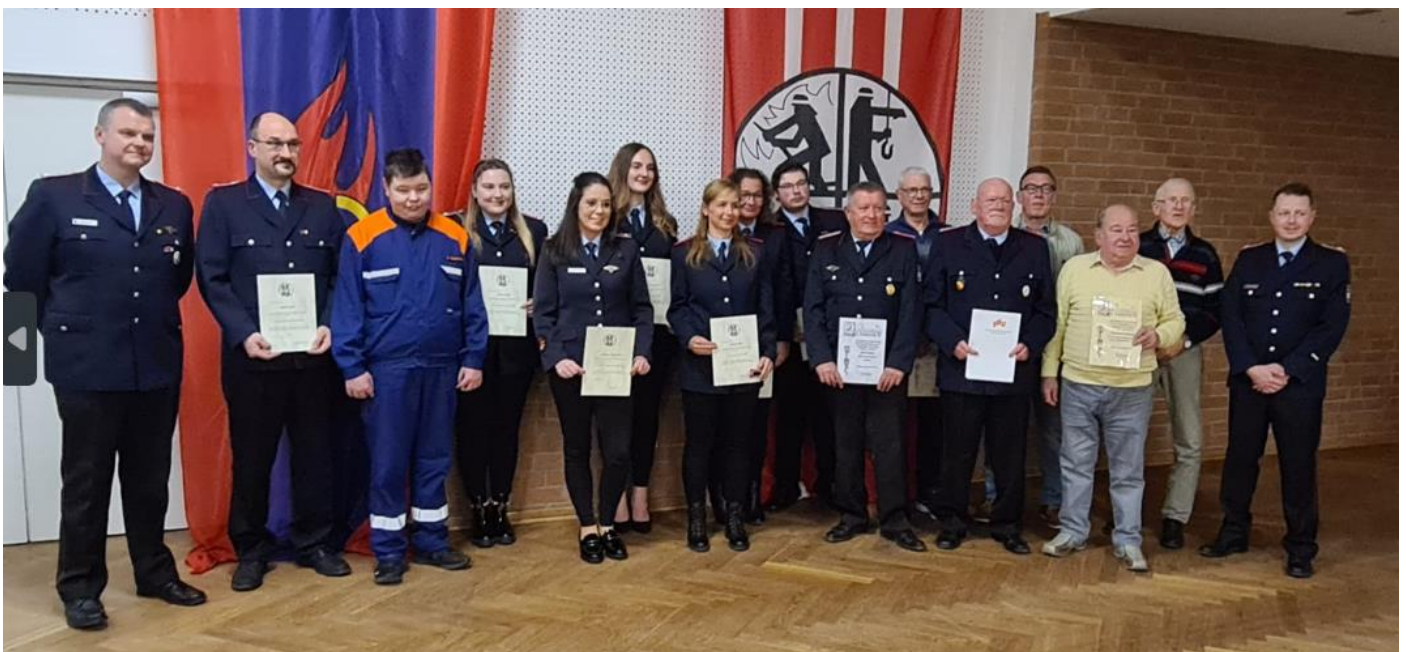
Gruppenfoto aller geehrten und Beförderten

In diesem Jahr wurden einige Kameradinnen und Kameraden befördert. Auch unsere Fördermitglieder erhielten Urkunden.