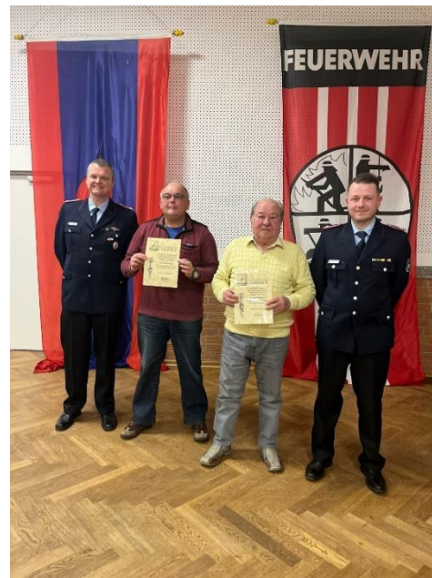
Ehrung der Fördermitglieder