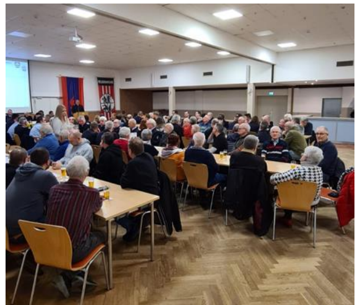
113 Gäste kamen zur Versammlung