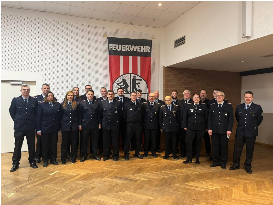
Gruppenfoto aller geehrten und Beförderten