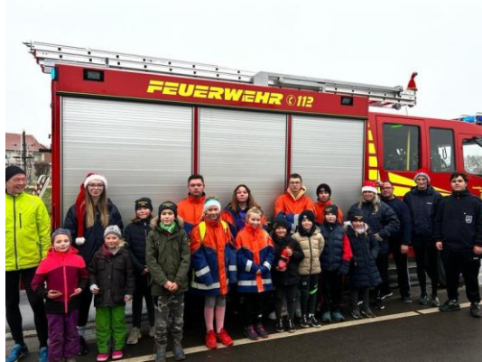
Spendenlauf in Velpke