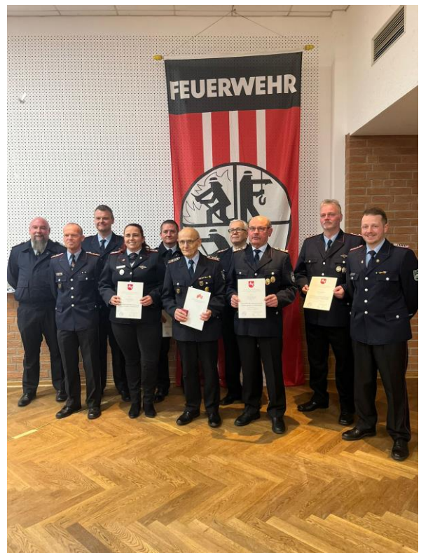
Ehrungen für 25/40/50 & 60 Jahre