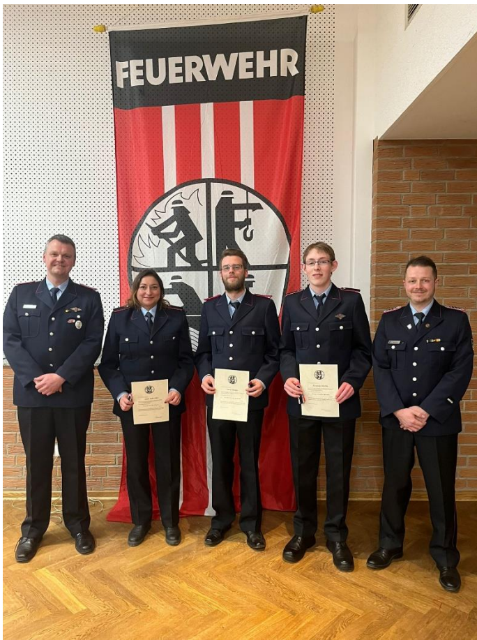
Beförderung Feuerwehrmann / Frau