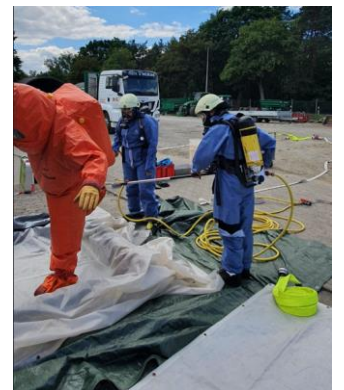
Gefahrgutübung bei Grewe & Jäger