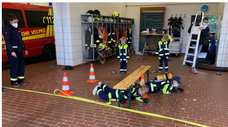
Atemschutzparcour für Kinderfeuerwehr