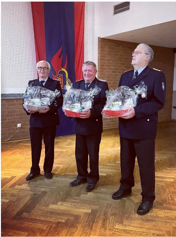
Verabschiedung aus der Einsatzabteilung: