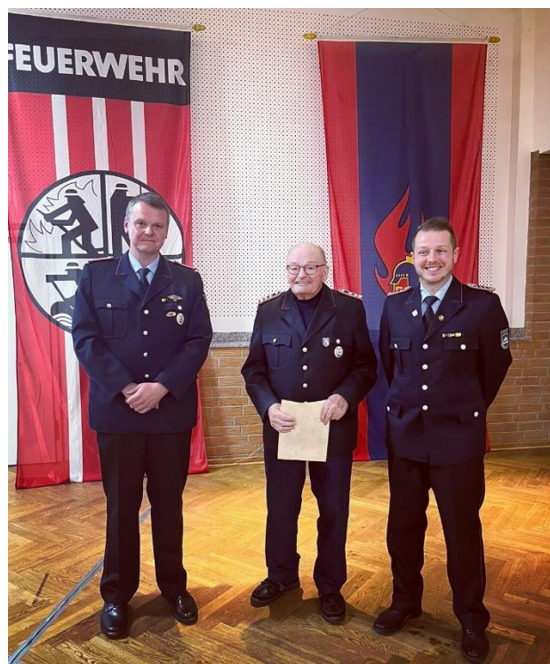
50 Jahre . H.Hanse