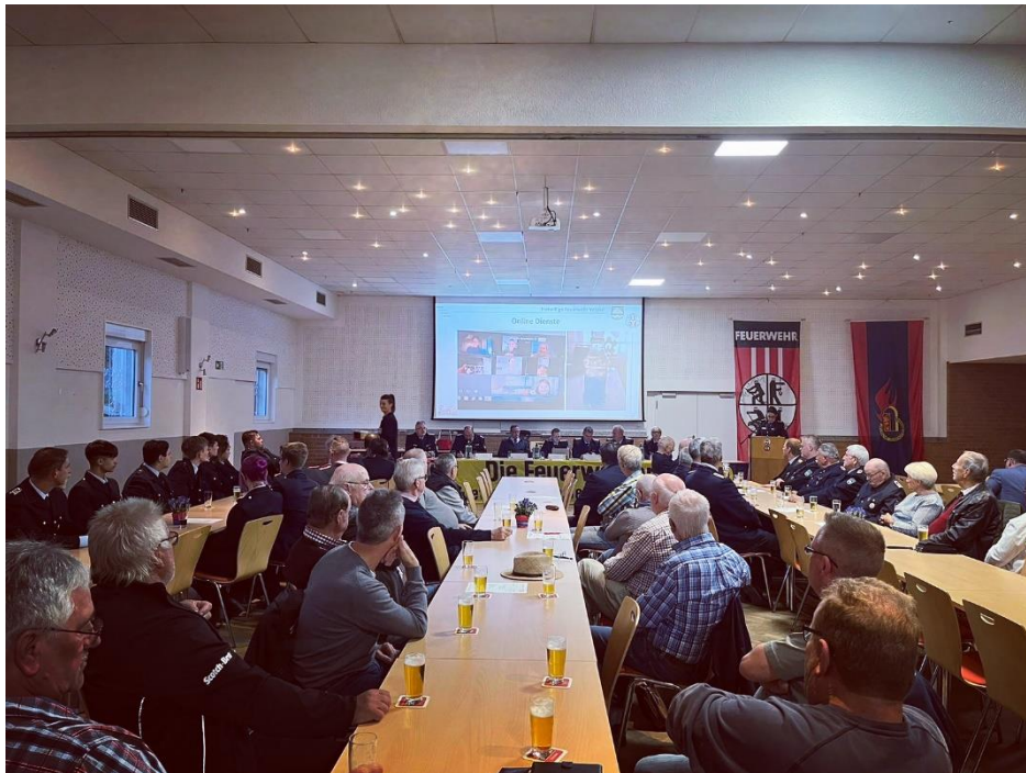
Erste öffentliche Versammlung ohne Einschränkungen