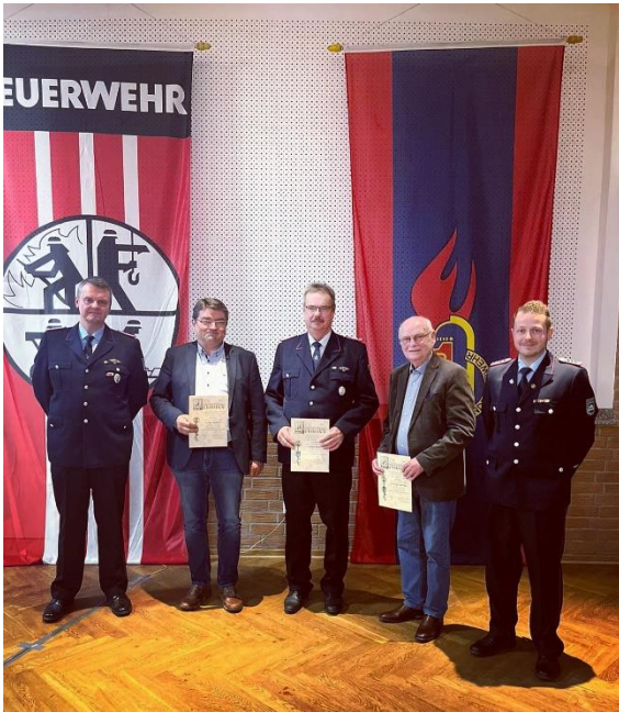
Ehrung für 40 Jahre Fördermitgliedschaft

Vor allem die Ehrungen unserer Fördermitglieder übertrafen bei dieser Versammlung alle Rekorde. Viele Ehrungen wurden noch aus dem Vorjahr nachgeholt und damit viele Urkunden übergeben. (12x 25 Jahre, 6x 40 Jahre und 4x50 Jahre)