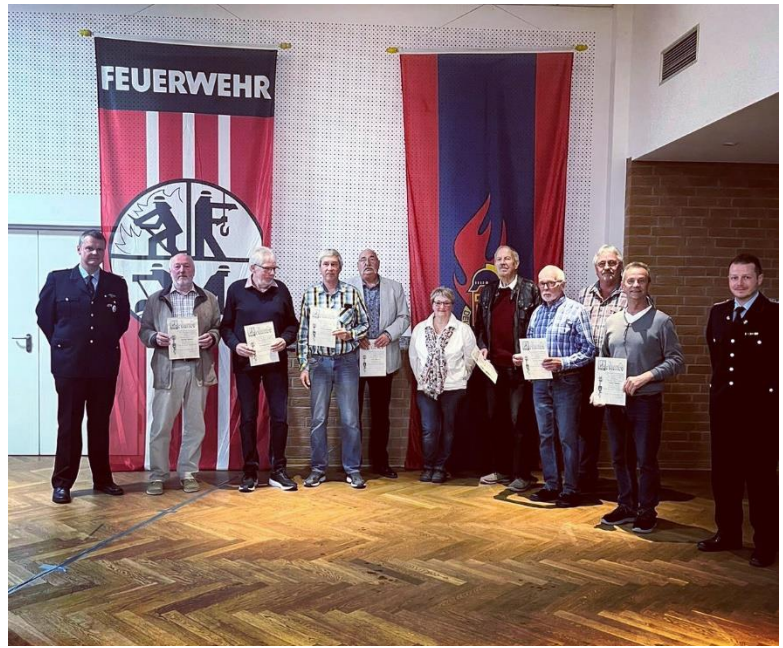
Ehrung für 25 Jahre Fördermitgliedschaft