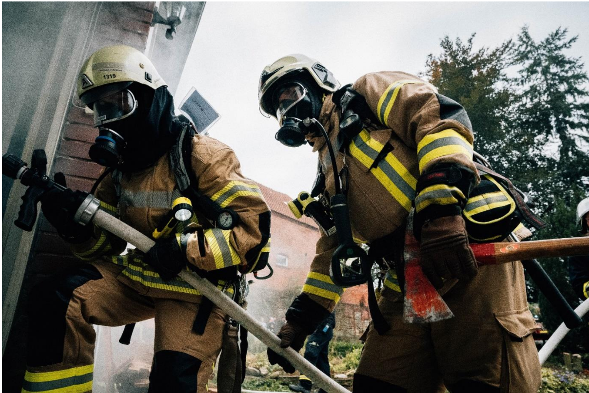
Zugübung in Rümmer